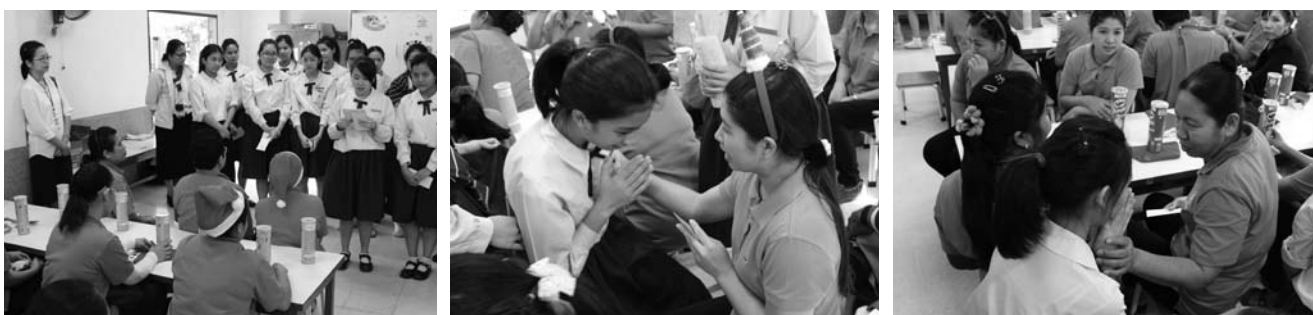
• สถานักเรียน จัดกิจกรรมขอบคุณเจ้าหน้าที่โรงเรียน ในโอกาสวันฉลองพระคริสตสมภพ ณ ห้องอาหารอนุบาล เมื่อวันที่ 23 ธันวาคม 2556