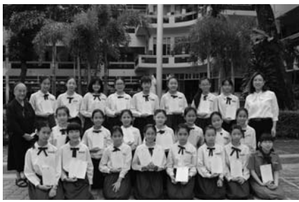
• นักเรียนชั้นประถมศึกษาปีที่ 1-6 รับเกียรติบัตร กลุ่มสาระภาษาจีน ณ อาคารเรียนประถม เมื่อวันที่ 20-21 พฤศจิกายน 2556