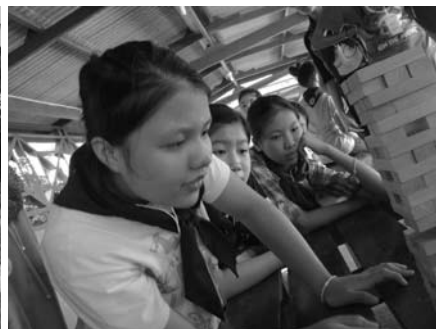
• ค่ายยุวกาชาดนักเรียนชั้นมัธยมศึกษาปีที่ 1 ณ บ้านเพชรสำราญ จ.ประจวบคีรีขันธ์ เมื่อวันที่ 8-10 มกราคม 2557