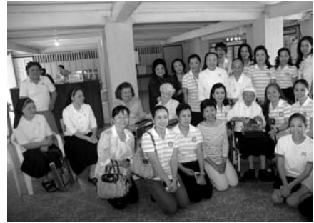
• คณะกรรมการสมาคมนักเรียนเก่ามาแต่ร์เดอีฯ กราบอวยพรคณะซิสเตอร์ ในโอกาสวันฉลองพระคริสตสมภพ เมื่อวันที่ 14 ธันวาคม 2556