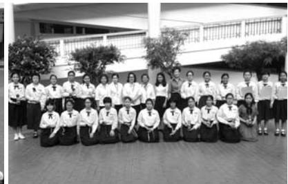
• นักเรียนชั้นมัธยมศึกษา รับรางวัลการแข่งขันเปิดแผนที่ กลุ่มสาระสังคมศึกษาฯ ณ ลานPIAZZA เมื่อวันที่ 17 ธันวาคม 2556