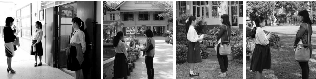
• นักเรียนชั้นประถมศึกษาปีที่ 6 ร่วมกิจกรรมมัดคุ้เทศก์น้อย โดย ผู้ปกครองเครือข่ายชั้นประถมศึกษา เมื่อวันที่ 21 มกราคม 2557