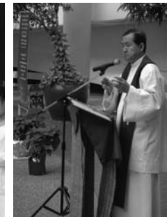
• พิธีรีวารของนักเรียนชั้นอนุบาล 3 ประถมศึกษา 1-6 และมัธยมศึกษา 1-6 เตรียมจิตใจสู่วันฉลองพระคริสตสมภพ เมื่อวันที่ 18-20 ธันวาคม 2556