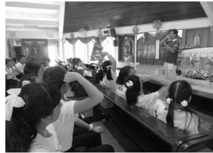
• นักเรียนชั้นประถมศึกษาปีที่ 5 ทักศนศึกษาวัดนักบุญอันนา ท่าจีน จ.สมุทรสาคร เมื่อวันที่ 6 และ 9 มกราคม 2557