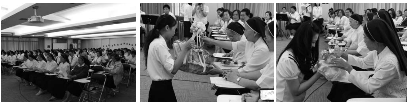
• คณะครูโรงเรียนมาแตร์เดอีวิทยาลัย กราบอวยพรคณะซิสเตอร์และผู้บริหาร ณ ห้องประชุมอัครนส เมื่อวันที่ 23 ธันวาคม 2556