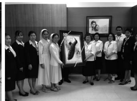
• ผู้บริหาร และคณะครูโรงเรียนอเวมารีอา อุบลราชธานี เข้าเยี่ยมชมการเรียนการสอนของโรงเรียน ณ ห้องประชุมอ๊กแนส เมื่อวันที่ 25 พฤศจิกายน 2556