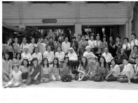
• นักเรียนเก่าเรยีนาเซลิเวียวิทยาลัย กราบอวยพรคณะซิสเตอร์ ในโอกาสวันฉลองพระคริสตสมภพ เมื่อวันที่ 14 ธันวาคม 2556