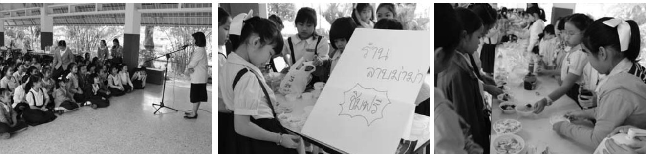
• กิจกรรมของกลุ่มสาระวิชาภาษาไทยนักเรียนชั้นประถมศึกษาปีที่ 3 ณ อาคารเรียนประถม เมื่อวันที่ 23 มกราคม 2557