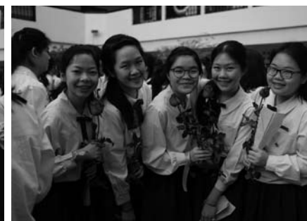
• กิจกรรมอำลา นักเรียนชั้นมัธยมศึกษาปีที่ 6 ปีการศึกษา 2556 ณ ลาน PIAZZA เมื่อวันที่ 10 มกราคม 2557