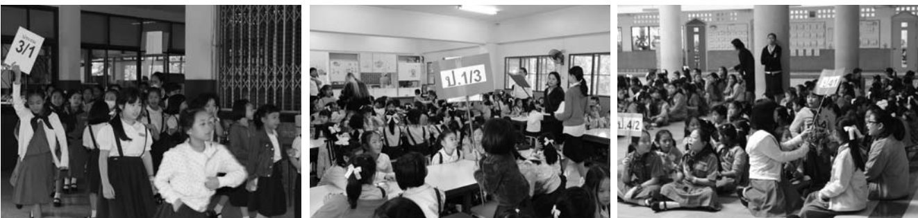
• การซ้อมทลบทยของนักเรียนระดับประถมศึกษา ณ อาคารเฉลิมพระเกียรติ เมื่อวันที่ 24 มกราคม 2557