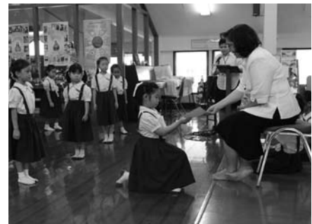
• พิธีรับเกียรติบัตรของนักเรียนระดับชั้นประถมศึกษาปีที่ 1-6 ณ อาคารเรียนประถม เมื่อวันที่ 6-12 พฤศจิกายน 2556