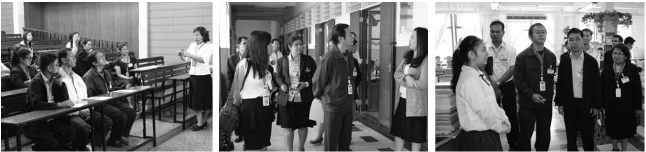
• คณะครูโรงเรียนในสังกัด กทม. เข้าเยี่ยมชมการเรียนการสอนของโรงเรียนมาแตร์เดอีวิทยาลัย ฝ่ายประถมศึกษา เมื่อวันที่ 21 มกราคม 2557