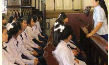
• นักเรียนชั้นประถมศึกษาปีที่ 6 ทักศนศึกษา ณ วัดแม่พระลูกประคำ (กาลหว้าจ๋) และวัดสุทัศนเทพวราราม ราชวรมหาวิหาร เมื่อวันที่ 21 มกราคม 2558