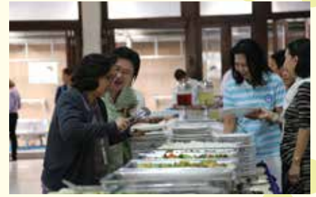
• สมาคมนักเรียนเก่ามาแตร์เดอีวิทยาลัย ในพระบรมราชูปถัมภ์ จัดเลี้ยงอาหารกลางวันให้กับคุณครู ในโอกาส "วันครู" เมื่อวันที่ 15 มกราคม 2558