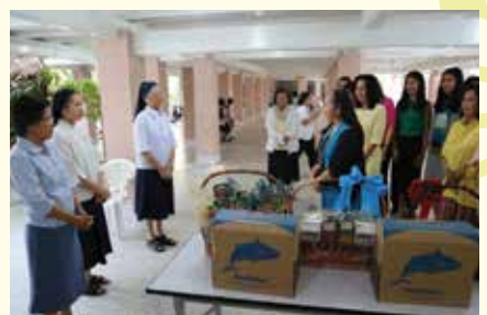
• สมาคมนักเรียนเก่ามาแตร์เดอีวิทยาลัยในพระบรมราชูปถัมภ์ ร่วมอวยพรคณะซิสเตอร์ในโอกาสวันฉลองพระคริสตสมภพ ณ บริเวณห้องรับแขกใต้โบสถ์มาแตร์เดอี เมื่อวันที่ 23 ธันวาคม 2557