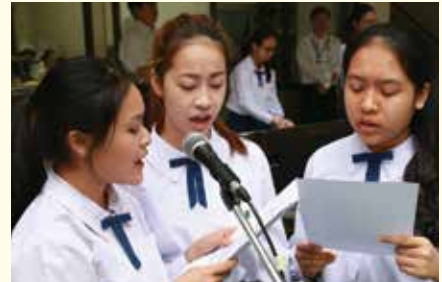
• พิธีตรววาร เตรียมฉลองวันพระคริสตสมภพ ณ ลานPIAZZA อาคารเฉลิมพระเกียรติ เมื่อวันที่ 17-19 ธันวาคม 2557