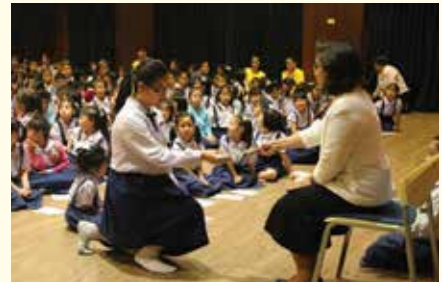
• พิธีมอบเกียรติบัตรคุณลักษณะอันพึงประสงค์ และเกียรติบัตรภาษาอังกฤษ ณ หอประชุมโรงเรียน เมื่อวันที่ 17 ธันวาคม 2557