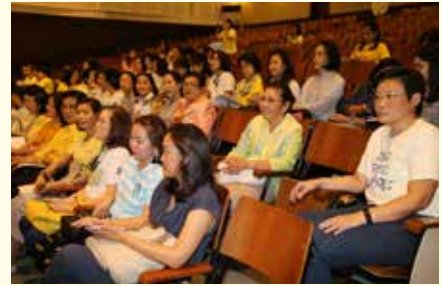
• การประชุมสมาคมนักเรียนเก่ามาแตร์เดอีวิทยาลัย ในพระบรมราชูปถัมภ์ ณ หอประชุมโรงเรียน เมื่อวันที่ 13 ธันวาคม 2557