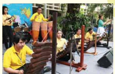
• งานเลี้ยง รื่นเริง คณะซิสเตอร์ คุณครู เจ้าหน้าที่ ในโอกาสวันฉลองพระคริสตสมภพ ณ ลานนักบุญอัญญา อาคารเรียนประถม เมื่อวันที่ 24 ธันวาคม 2557