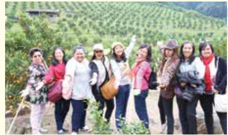
• คุณครู 27 ท่าน ทักศนศึกษา พระตำหนักภูพิงศ์ราชนิเวศน์-อ่างขาง จ.เชียงใหม่ เมื่อวันที่ 16-18 มกราคม 2558