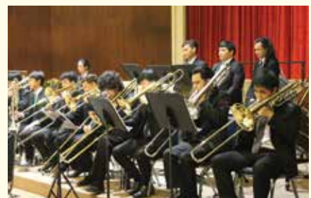
• นักเรียนชั้นประถมศึกษาปีที่ 5-6 เข้าชมการแสดง Silpakorn University Wind Orchestra Concert 2014 โดย นักศึกษาคณะดุริยางคศาสตร์ มหาวิทยาลัยศิลปากร ณ หอประชุมโรงเรียน เมื่อวันที่ 19 ธันวาคม 2557