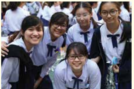
• งานอำนวยการนักเรียนชั้นมัธยมศึกษาปีที่ 6 รุ่น 85 โดยนักเรียนชั้นมัธยมศึกษาปีที่ 5 ณ ลานPIAZZA เมื่อวันที่ 14 มกราคม 2558