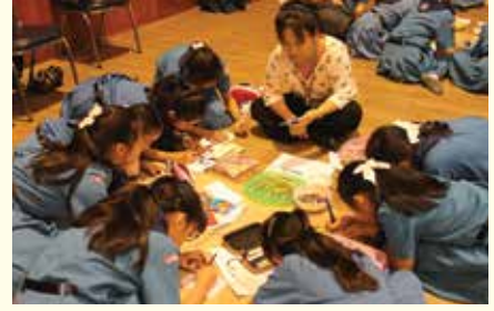
• นักเรียนชั้นประถมศึกษาปีที่ 4-5 ฟังบรรยายเรื่องมารยาท โดยเครือข่ายผู้ปกครองประถม 4-5 ณ หอประชุมโรงเรียน เมื่อวันที่ 9 มกราคม 2558