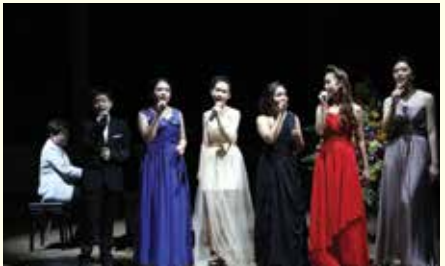
• นักเรียนสายศิลป์ดนตรี ชั้นมัธยมศึกษาปีที่ 6 แสดงดนตรีจบการศึกษา ณ หอประชุมโรงเรียน เมื่อวันที่ 9 มกราคม 2558