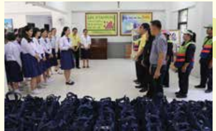
• สถานักเรียนมอบของขวัญ ในโอกาสวันพระคริสตสมภพให้กับเจ้าหน้าที่ กทม. ที่ช่วยอำนวยความสะดวกบริเวณรอบโรงเรียน ณ ห้องแมรี่ ออฟ ดี อินคาร์เนชั่น เมื่อวันที่ 23 ธันวาคม 2557