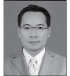
ฝ่ายการศึกษา