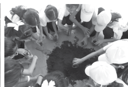
• นักเรียนชั้นประถมศึกษาปีที่ 5 ทักษะศึกษาพิพิธภัณฑ์การเกษตรเฉลิมพระเกียรติ พระบาทสมเด็จพระเจ้าอยู่หัว จ.ปทุมธานี เมื่อวันที่ 7-10 กรกฎาคม 2558