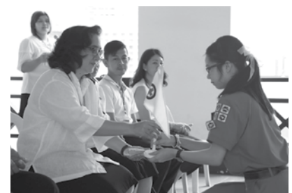
• พิธีประดับเครื่องหมายยุวกาชาด นักเรียนชั้นมัธยมศึกษาปีที่ 3 ณ ลานชั้น 6 เมื่อวันที่ 9 กรกฎาคม 2558