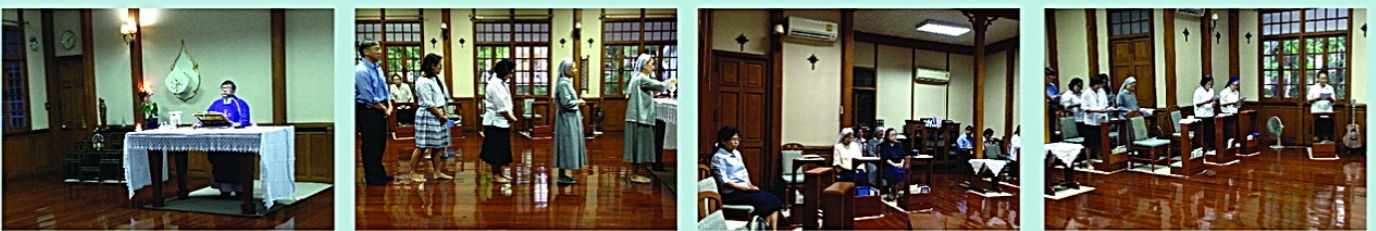
• พิธีมิสซาและภาวนา เพื่อผู้เสียชีวิตในเหตุการณ์ระเบิดแยกราชประสงค์ ณ วัดน้อยมาแตร์เดอี เมื่อวันที่ 21 สิงหาคม 2558