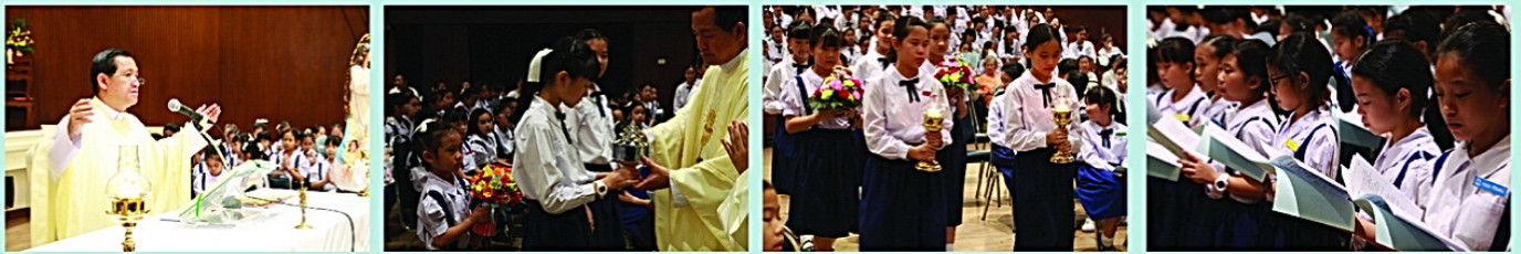
• พิธีมิสซาสมโภชพระนางมารีย์รับเกียรติเข้าสู่สวรรค์ ณ หอประชุมโรงเรียน เมื่อวันที่ 13 สิงหาคม 2558