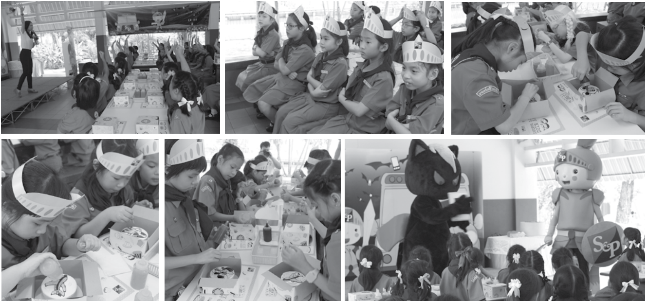
• นักเรียนชั้นประถมศึกษาปีที่ 3 เข้าร่วมกิจกรรมแต่งหน้าเด็ก จัดโดย บริษัท เอส แอนด์ พี ซินดิเคท จำกัด (มหาชน) ลานประดม 1-2 เมื่อวันที่ 17 กรกฎาคม 2558