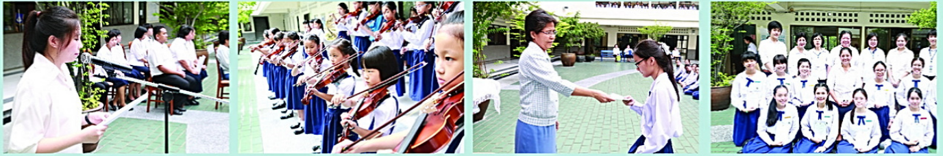
• นักเรียนร่วมกิจกรรมวันภาษาไทย ณ ลานPiazza เมื่อวันที่ 5 สิงหาคม 2558