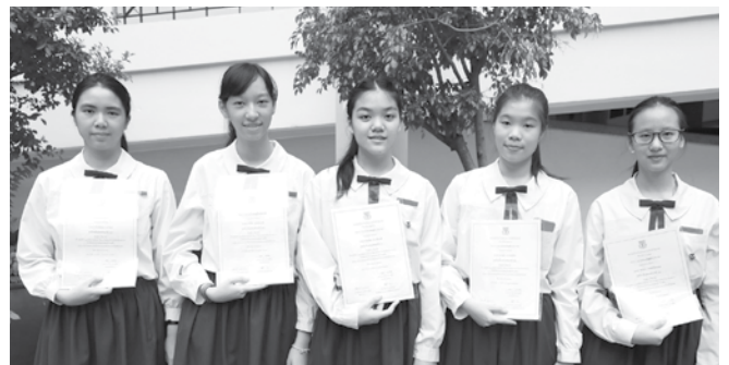
• สภานักเรียนเขตชูผู้มีระเบียบวินัย เดือน กรกฎาคม ณ ลานPIAZZA เมื่อวันที่ 9 กรกฎาคม 2558