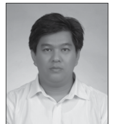
ฝ่ายกิจกรรม