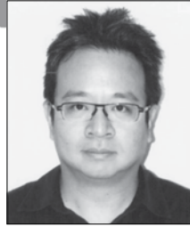
คุณธันต์ สิงสุวิช อุปนายกคนที่ 1