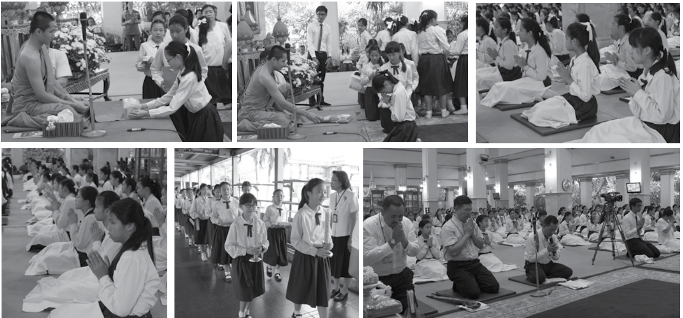
• นักเรียนชั้นประถมศึกษาปีที่ 6 ถวายเทียนพรรษา ณ วัดปทุมวนาราม ราชวรวิหาร เมื่อวันที่ 23 กรกฎาคม 2558