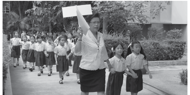
• การซ้อมหนีไฟของโรงเรียนมาแตร์เดอีวิทยาลัย โดย ฝ่ายรักษาความปลอดภัย เมื่อวันที่ 9 กรกฎาคม 2558