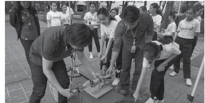
• นักเรียนชั้นประถมศึกษาปีที่ 6 ทักษะศึกษาท้องฟ้าจำลอง เมื่อวันที่ 6 กรกฎาคม 2558