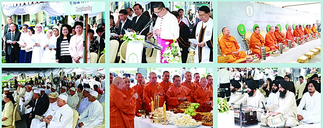
• คณะซิสเตอร์โรงเรียนมาแตร์เดอีวิทยาลัย ร่วมพิธีบำเพ็ญกุศล 5 ศาสนา เพื่ออุทิศแด่ผู้เสียชีวิตในเหตุระเบิดราชประสงค์ ประกอบด้วย ศาสนาพุทธนิกายมหายาน ศาสนาอิสลาม ศาสนาซิกข์ ศาสนาคริสต์ และศาสนาพราหมณ์-ฮินดู ณ บริเวณลานหน้าเซ็นทรัลเวิลด์ เมื่อวันที่ 21 สิงหาคม 2558