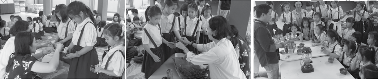
• กิจกรรมคุณแม่อาสา นักเรียนชั้นประถมศึกษา 1-3 ณ ลาน กอท. เมื่อวันที่ 16 กรกฎาคม 2558