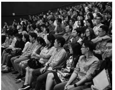
• การประชุมนิเทศผู้ปกครองนักเรียนอนุบาล 3 และนักเรียนประถมศึกษาปีที่ 1 ณ หอประชุมโรงเรียนมาแตร์เดอีวิทยาลัย เมื่อวันที่ 3 กุมภาพันธ์ 2561