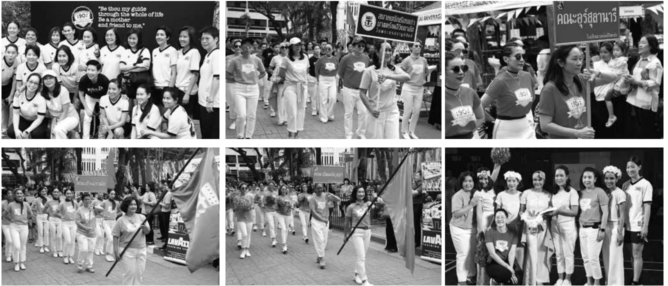
• งาน 90 ปี มาแตร์เดอี จัดโดย สมาคมนักเรียนเก่ามาแตร์เดอวีวิทยาลัย ในพระบรมราชูปถัมภ์ เมื่อวันที่ 3 กุมภาพันธ์ 2561