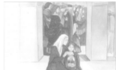
'...young girls were not receiving adequate religious training...'

At this time, Angela did take into her heart the fact that young girls were not receiving adequate religious training and that their family lives were not at all happy. After contemplation, she felt a strong desire to join the Third Order of Saint Francis, a religious order for lay people to work for God and develop in their Christian faith. Being a person of insight, Angela used a room in her home as a school, welcoming young girls from the town and teaching them Christian values that they could take back to their families.