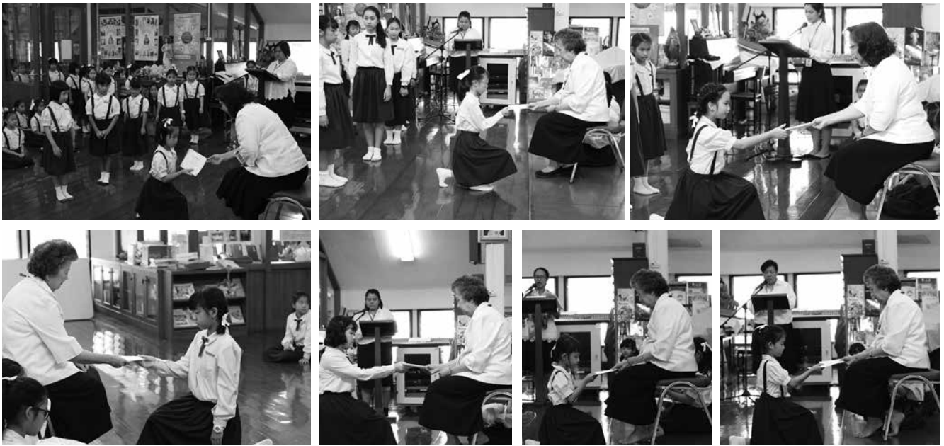
• พิธีรับเกียรติบัตรนักเรียนระดับประถมศึกษาปีที่ 1 — มัธยมศึกษาปีที่ 6 ณ โรงเรียนมาแตร์เดอีวิทยาลัย เมื่อวันที่ 28 พฤษภาคม ถึง 8 มิถุนายน 2561