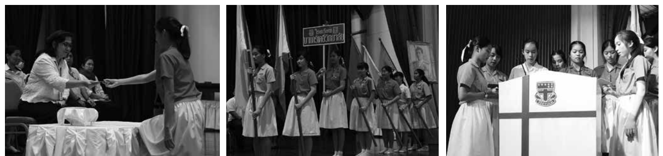
• พิธีมอบตำแหน่งสภานักเรียน ณ หอประชุมโรงเรียนมาแตร์เดอวีวิทยาลัย เมื่อวันที่ 9 กุมภาพันธ์ 2561