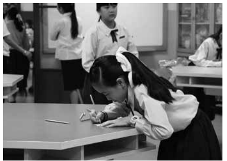
• กิจกรรมเลือกตั้ง สภานักเรียน ระดับประถมศึกษา ณ โรงเรียนมาแตร์เดอีวิทยาลัย เมื่อวันที่ 2 กุมภาพันธ์ 2561