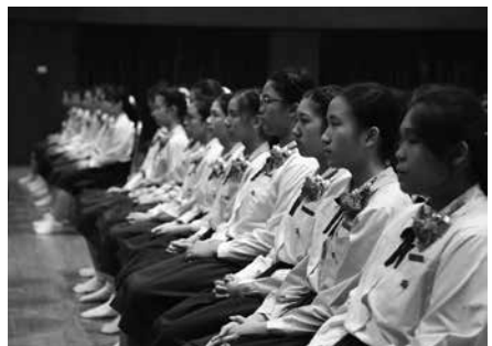
• พิธีรับประกาศนียบัตร นักเรียนชั้นมัธยมศึกษาปีที่ 3 ณ หอประชุมโรงเรียนมาแตร์เดอีวิทยาลัย เมื่อวันที่ 16 มีนาคม 2561