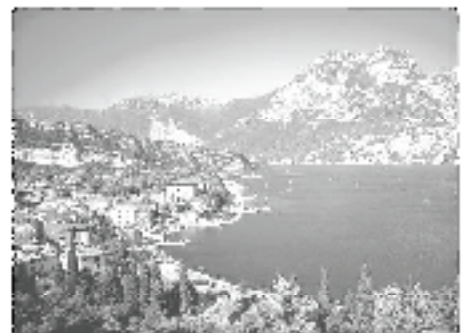
'Her town was situated on a lake ...'

Let us think about the young Angela, born sometime between 1470 and 1475 in Desenzano, Northern Italy. What things did she experience in her daily life? She was young and full of life, loving to do the things all children love doing. Her town was situated on a lake, Lake Garda, so it would have been a lovely place to grow up. She did move, with her family, to Le Gocce, a more rural part of her city-state. Here she would have had the experience of doing farm chores and just enjoying living a quiet country life. In all the places she lived, it is said that Angela brought much joy to her local community.