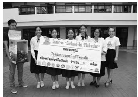
• สถานักเรียน มอบอุปกรณ์เครื่องมือสื่อสารไปริไซเคิล ในโครงการ “มือถือเก่าไป ชีวิตใหม่มา” ที่นำรายได้ไปจัดหาหนังสือสำหรับเด็กและสื่อเพื่อการศึกษา ให้แก่ ศูนย์พัฒนาเด็กเล็ก สำนักงานท้องถิ่นจังหวัดที่ขาดแคลนในถิ่นทุรกันดาร เมื่อวันที่ 15 กุมภาพันธ์ 2561