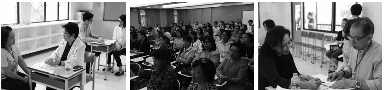
• การแปลผลการตรวจสุขภาพครู โดย สมาคมนักเรียนเก่ามาแตร์เดอีวิทยาลัย ในพระบรมราชูปถัมภ์ ณ โรงเรียนมาแตร์เดอีวิทยาลัย เมื่อวันที่ 11 พฤษภาคม 2561