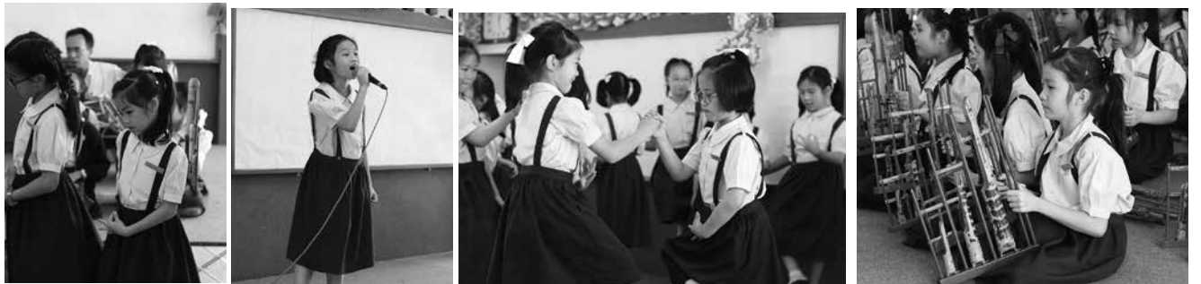
• กิจกรรมสวนศิลป์ นักเรียนประถมศึกษา ณ โรงเรียนมาแตร์เดอวีวิทยาลัย เมื่อวันที่ 5 ถึง 7 กุมภาพันธ์ 2561