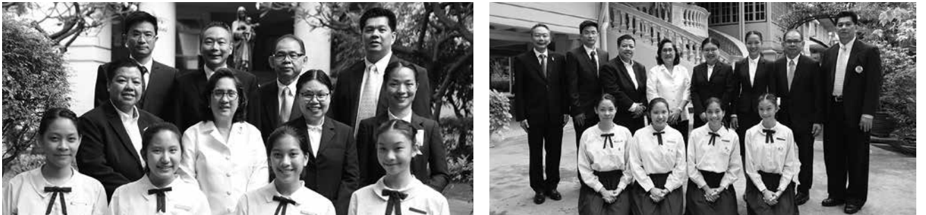
• สมาคมผู้ปกครองและครู และผู้บริหารโรงเรียนมาแตร์เดอีวิทยาลัย นำรายได้จากการจัดงานคอนเสิร์ตฟ้าหลังฝน ถวายแด่สมเด็จพระเทพรัตนราชสุดาฯ สยามบรมราชกุมารี ณ ศาลาดุสิดาลัย สวนจิตรดา พระราชวังดุสิต เมื่อวันที่ 21 มีนาคม 2561