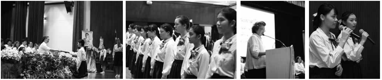
• พิธีรับประกาศนียบัตร นักเรียนชั้นมัธยมศึกษาปีที่ 6 ณ หอประชุมโรงเรียนมาแตร์เดอีวิทยาลัย เมื่อวันที่ 20 มีนาคม 2561