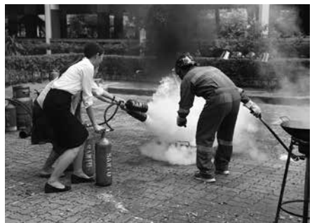
• คุณครู และเจ้าหน้าที่รักษาความปลอดภัยเข้ารับอบรมการดับเพลิง จัดโดย ฝ่ายรักษาความปลอดภัย ณ โรงเรียนมาแตร์เดอีวิทยาลัย เมื่อวันที่ 14 พฤษภาคม 2561