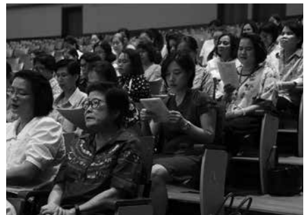
• การประชุมปิดภาคเรียนที่ 2 ปีการศึกษา 2560 ณ หอประชุมโรงเรียนมาแตร์เดอีวิทยาลัย เมื่อวันที่ 14 มีนาคม 2561