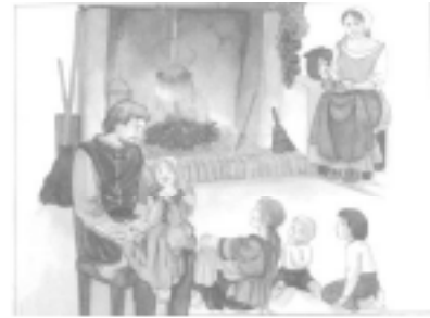
'Her family was really lovely'.