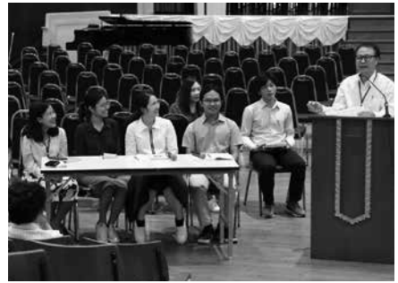
• การประชุมครูเปิดภาคเรียนที่ 1 ปีการศึกษา 2561 ณ หอประชุมโรงเรียนมาแตร์เดอีวิทยาลัย เมื่อวันที่ 14 พฤษภาคม 2561