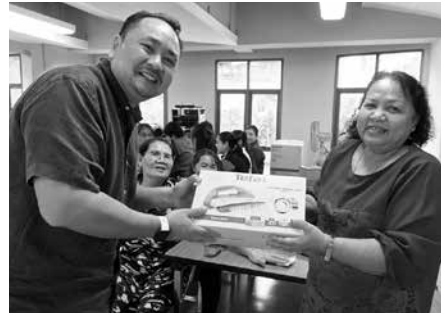
• สมาคมผู้ประกอบการและครูโรงเรียนมาแตร์เดอีวิทยาลัย จัดกิจกรรมนันทนาการให้กับเจ้าหน้าที่โรงเรียน ณ ห้องแมรี่ ออฟ ดิ อีคาร์เนชัน เมื่อวันที่ 11 พฤษภาคม 2561