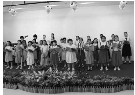
• นักเรียนกลุ่มขับร้องประสานเสียง จัดกิจกรรม “ศิลปะอสาสามาส่งสุข” ณ โรงพยาบาลตำรวจ เมื่อวันที่ 9 กุมภาพันธ์ 2561