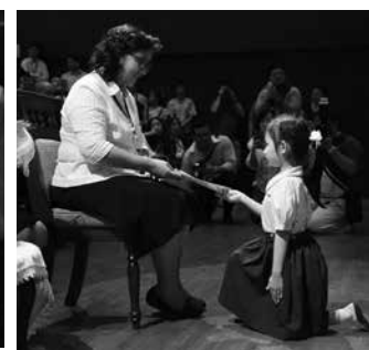
• งานปิดภาคอนุบาล ปีการศึกษา 2560 ณ หอประชุมโรงเรียน เมื่อวันที่ 15 กุมภาพันธ์ 2561