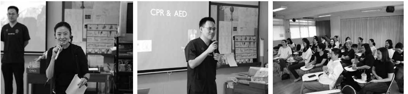
• สมาคมนักเรียนเก่ามาแตร์เดอีวิทยาลัย ในพระบรมราชูปถัมภ์ จัดกิจกรรมการฝึกอบรมการช่วยชีวิตขั้นพื้นฐาน "การ CPR การใช้เครื่อง AED และการช่วยชีวิตจากการสำลัก" โดย ทีมแพทย์จากโรงพยาบาลจุฬาลงกรณ์ ณ ห้องประชุม อาคารเฉลิมพระเกียรติ โรงเรียนมาแตร์เดอีวิทยาลัย เมื่อวันที่ 5 พฤษภาคม 2561