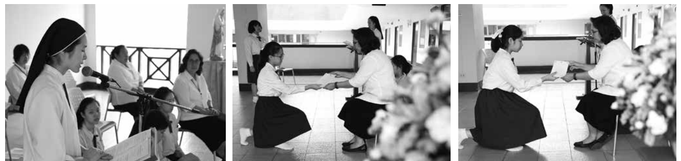
• นักเรียนคาทอลิก รับเกียรติบัตรคำสอน ณ โรงเรียนมาแตร์เดอวีวิทยาลัย เมื่อวันที่ 7-8 กุมภาพันธ์ 2561