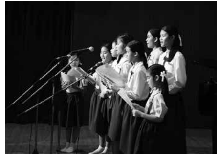
• นักเรียน และคุณครู ร่วมฉลองวันก่อตั้งโรงเรียน ณ หอประชุมโรงเรียนมาแตร์เดอีวิทยาลัย เมื่อวันที่ 2 กุมภาพันธ์ 2561