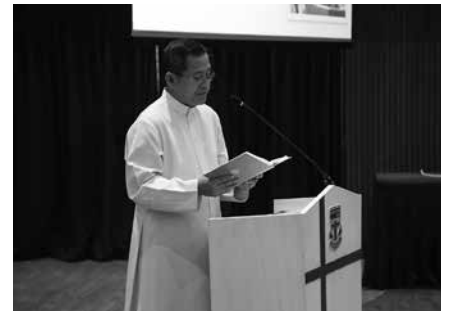
• การประชุมเครือข่ายผู้ปกครองคาทอลิก โรงเรียนมาแตร์เดอีวิทยาลัย ณ หอประชุมโรงเรียนมาแตร์เดอีวิทยาลัย เมื่อวันที่ 25 พฤษภาคม 2561