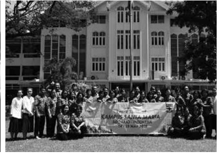
• คณะครู และซิสเตอร์ จากโรงเรียน Santa Maria II, East Java, INDONESIA มาเยี่ยมเยือน โรงเรียนมาแตร์เดอีวิทยาลัย เมื่อวันที่ 16 พฤษภาคม 2561